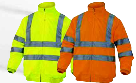
RENO HV TAGLIA: DA S A 3XL Cod. 90634

GILET ALTA VISIBILITÀ EN471 2.2 - CHIUSURA CON FASCIA AUTO-STRINGENTE - BANDE PARALLELE ARGENTO