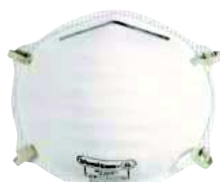
M1100 TAGLIA: UNICA Cod. 90614

CONFEZIONE DA 10 MASCHERINE FILTRANTI FFP2 PREFORMATE CON VALVOLA D'ESPIRAZIONE ALTAMENTE PERFORMANTE. FASCE ELASTICHE. IN PRATICO SACCHETTO IGIENICO SINGOLO. TESTATA DOLOMIA