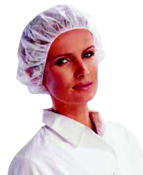
PO110 TAGLIA: UNICA

CONFEZIONE DA 50 PAIA DI SOVRA-SCARPE DA VISITATORE IN POLIETILENE.