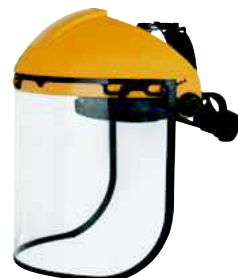
BALB12 TAGLIA: UNICA Cod. 90606

ELMETTO DI PROTEZIONE IN PP. CUFFIA: 3 FASCE TESSILI CON 8 PUNTI DI FISSAGGIO. CHIUSURA A CREMAGLIERA REGOLABILE.