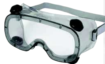
RUIZ1 TAGLIA: UNICA Cod. 90607

ARCHETTO CON TAPPI AURICOLARI ROTONDI SNR 20