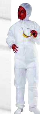
PO106 TAGLIA: DA M A XXL Cod. 90622

CONFEZIONE DA 100 CUFFIE ROTONDE IN POLIPROPILENE 14 GR/M2