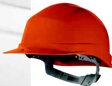
ZIRCON1 TAGLIA: UNICA Cod. 90604

CUFFIA ANTIRUMORE SNR 28 ARCHETTO IN ABS REGOLABILE IN ALTEZZA