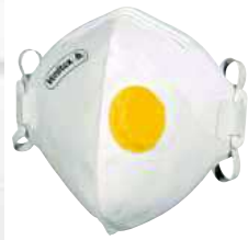
M1200VB TAGLIA: UNICA Cod. 90616

CONFEZIONE DA 10 MASCHERINE FILTRANTI FFP3 PREFORMATE CON VALVOLA D'ESPIRAZIONE ALTAMENTE PERFORMANTE. FASCE ELASTICHE. IN PRATICO SACCHETTO IGIENICO SINGOLO