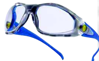
PACAYA CLEAR TAGLIA: UNICA Cod. 90609

ELMETTO DI PROTEZIONE IN POLIETILENE ALTA DENSITA' (HDPE). CUFFIA CON 8 PUNTI DI FISSAGGIO. CASCO DIELETTICO 1000 VAC O 1500 VCC.