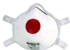
M1300V TAGLIA: UNICA Cod. 90612

CONFEZIONE DA 5 MASCHERINE FILTRANTI FFP3 PREFORMATE CON VALVOLA D'ESPIRAZIONE ALTAMENTE PERFORMANTE. FASCE ELASTICHE REGOLABILI. TESTATA DOLOMIA