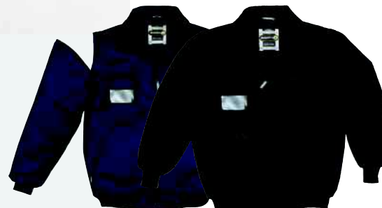
RENO TAGLIA: S A 3XL Cod. 90630

GILET BICOLORE IMBOTTITO CON PORTA-BADGE INCLUSO. ELASTICO SUI LATI. 5 TASCHE