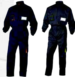
M6COM TAGLIA: DA XS A 3XL Cod. 90626

GILET PANOSTYLE 65% POLIESTERE 35% COTONE 235 g/m 2 : 6 TASCHE. CHIUSURA ZIP