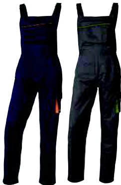
M6SAL TAGLIA: DA XS A 3XL Cod. 90627

PANTALONI DA LAVORO ALTA VISIBILITÀ BICOLORE PANOSTYLE IN COTONE / POLIESTERE 260 gr/m 2 EN471 2,2 - LATI VITA ELASTICIZZATI - 5 TASCHE