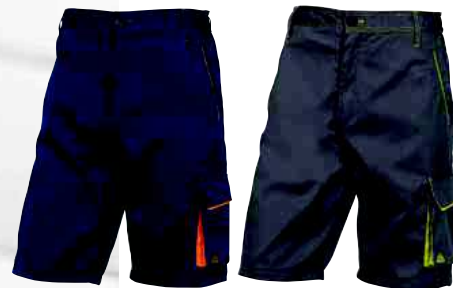
M6BER TAGLIA: DA S A 3XL Cod. 90628

SALOPETTE PANOSTYLE 65% POLIESTERE 35% COTONE 235 g/m 2 : 6 TASCHE.