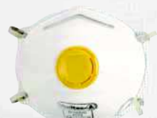
M1200V TAGLIA: UNICA Cod. 90613

CONFEZIONE DA 5 MASCHERINE FILTRANTI FFP3 PREFORMATE CON VALVOLA D'ESPIRAZIONE ALTAMENTE PERFORMANTE. FASCE ELASTICHE REGOLABILI. TESTATA DOLOMIA