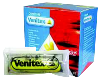
CONIC200 TAGLIA: UNICA Cod. 90601

TAPPI AURICOLARI MONOUSO IN POLIURETANO SNR 37 IN CONFEZIONE DA 2 TAPPI. SCATOLA DISPENSER DA 200 PAIA