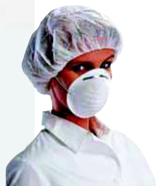
MASQU TAGLIA: UNICA Cod. 90618

CONFEZIONE DA 10 MASCHERINE FILTRANTI FFP1 PREFORMATE CON VALVOLA D'ESPIRAZIONE ALTAMENTE PERFORMANTE. FASCE ELASTICHE. IN PRATICO SACCHETTO IGIENICO SINGOLO