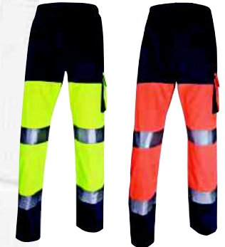
PHPAN TAGLIA: DA S A 3XL Cod. 90632

PARKA IN POLIESTERE PONGEE SPALMATO PVC - FODERA IN PILE - CAPPUCIO STACCABILE - 7 TASCHE - STRISCE RIFLETTENTI E DECORATIVE