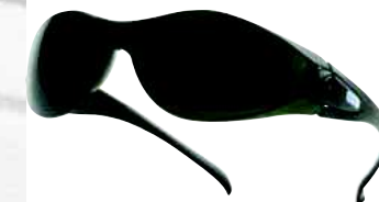
PACAYA T5 TAGLIA: UNICA Cod. 90610

OCCHIALI IN POLICARBONATO TRASPARENTE. NASELLO INTEGRATO. PROTEZIONE OCULARE ANTIPOLVERE E ANTIURTO RIMOVIBILE. STANGHETTE REGOLABILI.