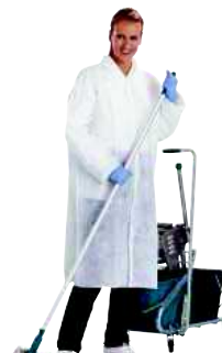
BLOUSPO TAGLIA: DA M A XL Cod. 90619

CONFEZIONE DA 50 MASCHERE D'IGIENE CON ELASTICO E BARRETTA STRINGINASO