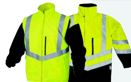
OPTIMUM TAGLIA: DA S A 3XL

GIUBBOTTO "BOMBER" POLIESTERE OXFORD SPALMATO PU MANICHE STACCABILI - COLLO FODERATO PILE