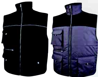
HERALD TAGLIA: DA S A 3XL Cod. 90629

GIUBBOTTO HIVI POLIESTERE OXFORD SPALMATO PU - - MANICHE STACCABILI - COLLO FODERATO PILE - CAPPUCIO A SCOMPARSA - ALTA VISIBILITÀ CLASSE 3 (GILET CLASSE 2) - ANTIPIOGGIA