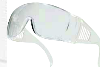
PITON CLEAR TAGLIA: UNICA Cod. 90608

OCCHIALI A MASCHERA IN POLICARBONATO INCOLORE, MONTATURA FLESSIBILE IN PVC. VENTILAZIONE TRAMITE 4 AERATORI.