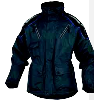
RUSSEL TAGLIA: DA S A 3XL Cod. 90631

TUTA 1 ZIP PANOSTYLE 65% POLIESTERE 35% COTONE 235 g/m 2 : VITA ELASTICIZZATA. POLSINI ELASTICIZZATI. 7 TASCHE