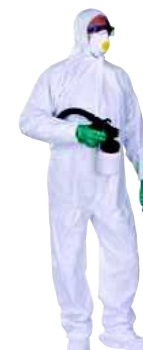
DT115 TAGLIA: DA M A XXL Cod. 90623

TUTA CON CAPPUCCIO IN POLIPROPILENE ELASTICIZZATA. CHIUSURA ZIP.