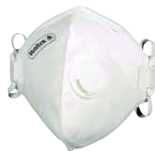
M1100VB TAGLIA: UNICA Cod. 90617

CONFEZIONE DA 10 MASCHERINE FILTRANTI FFP2 PREFORMATE CON VALVOLA D'ESPIRAZIONE ALTAMENTE PERFORMANTE. FASCE ELASTICHE. IN PRATICO SACCHETTO IGIENICO SINGOLO