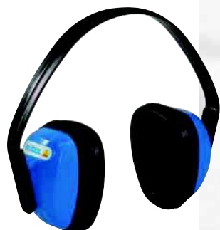
SPA3 TAGLIA: UNICA Cod. 90603

OCCHIALI IN POLICARBONATO TRASPARENTE CON PROTEZIONI LATERALI. VENTILAZIONE DIRETTA LATERALE.