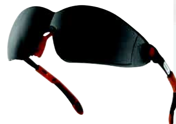
VULCANO2 SMOKE TAGLIA: UNICA Cod. 90611

PORTA-VISIERA CON PROTEZIONE FRONTALE E VISIERA IN POLICARBONATO