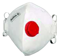
M1300VB TAGLIA: UNICA Cod. 90615

CONFEZIONE DA 20 MASCHERINE FILTRANTI FFP1 PREFORMATE. TESTATA DOLOMIA