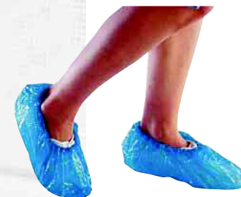
SURCHPE TAGLIA: UNICA Cod. 90620

CAMICE IN POLIPROPILENE NON TESSUTO. CHIUSURA CON 4 BOTTONI A PRESSIONE.