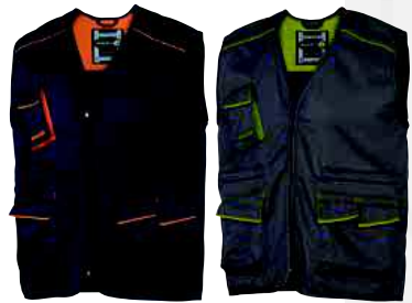
M6GIL TAGLIA: DA XS A 3XL Cod. 90625

GILET PANOSTYLE 65% POLIESTERE 35% COTONE 235 g/m 2 : 6 TASCHE. CHIUSURA ZIP