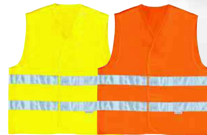
GILP2 TAGLIA: L/XXL Cod. 90633

BERMUDA PANOSTYLE 65% POLIESTERE 35% COTONE 235 g/m 2 : VITA ELASTICIZZATA. 5 TASCHE