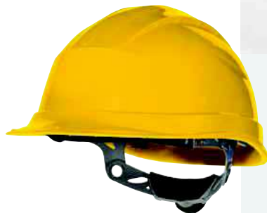
QUARTZ III UP TAGLIA: UNICA Cod. 90605

OCCHIALI IN POLICARBONATO TINTA 5 PER SALDATURA. NASELLO INTEGRATO. PROTEZIONE OCULARE ANTIPOLVERE E ANTIURTO RIMOVIBILE. STANGHETTE REGOLABILI.