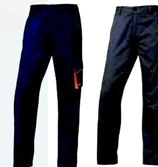
M6PAN TAGLIA: XS A 3XL Cod. 90624

TUTA PER PROTEZIONE DA RISCHIO CHIMICO TIPO 5,6 E PROTEZIONE ANTISTATICA EN 1149. TESSUTO MICROPOROSO LAMINATO